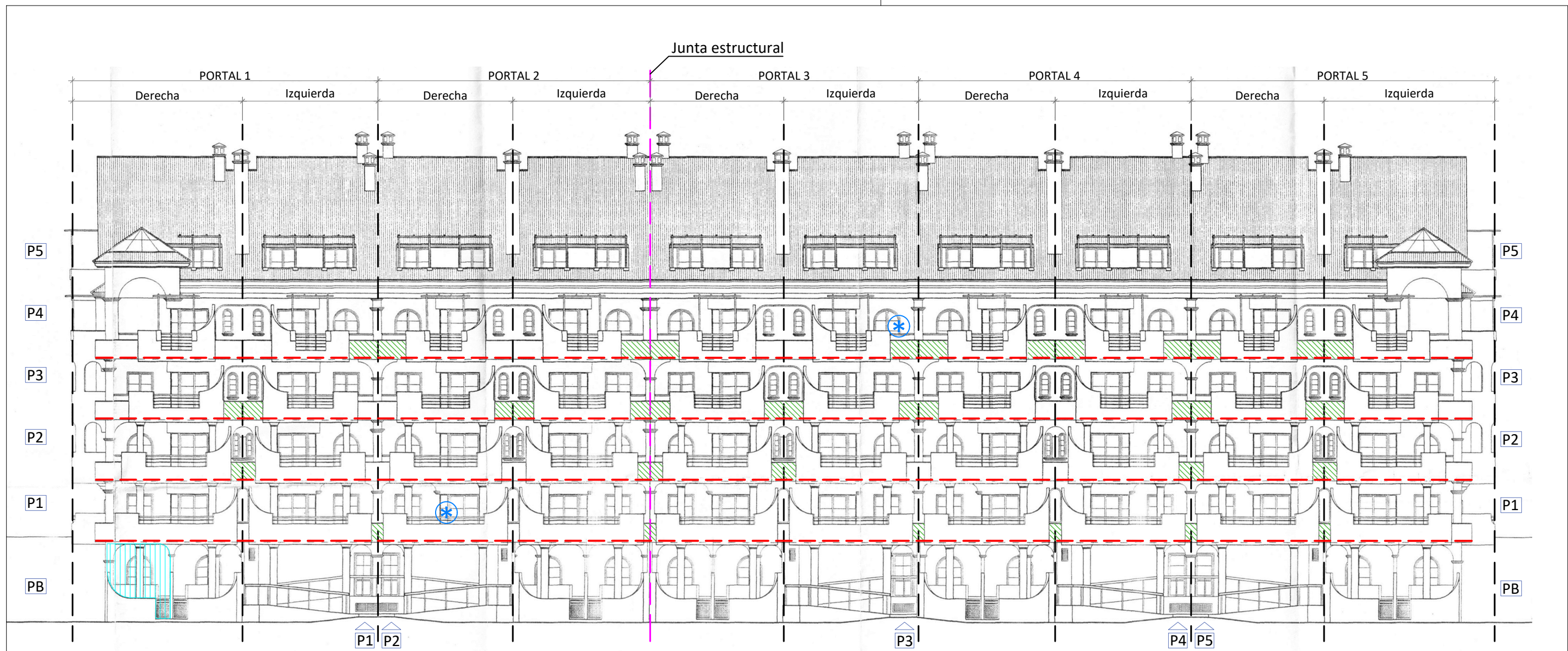
ALZADO PRINCIPAL NORESTE