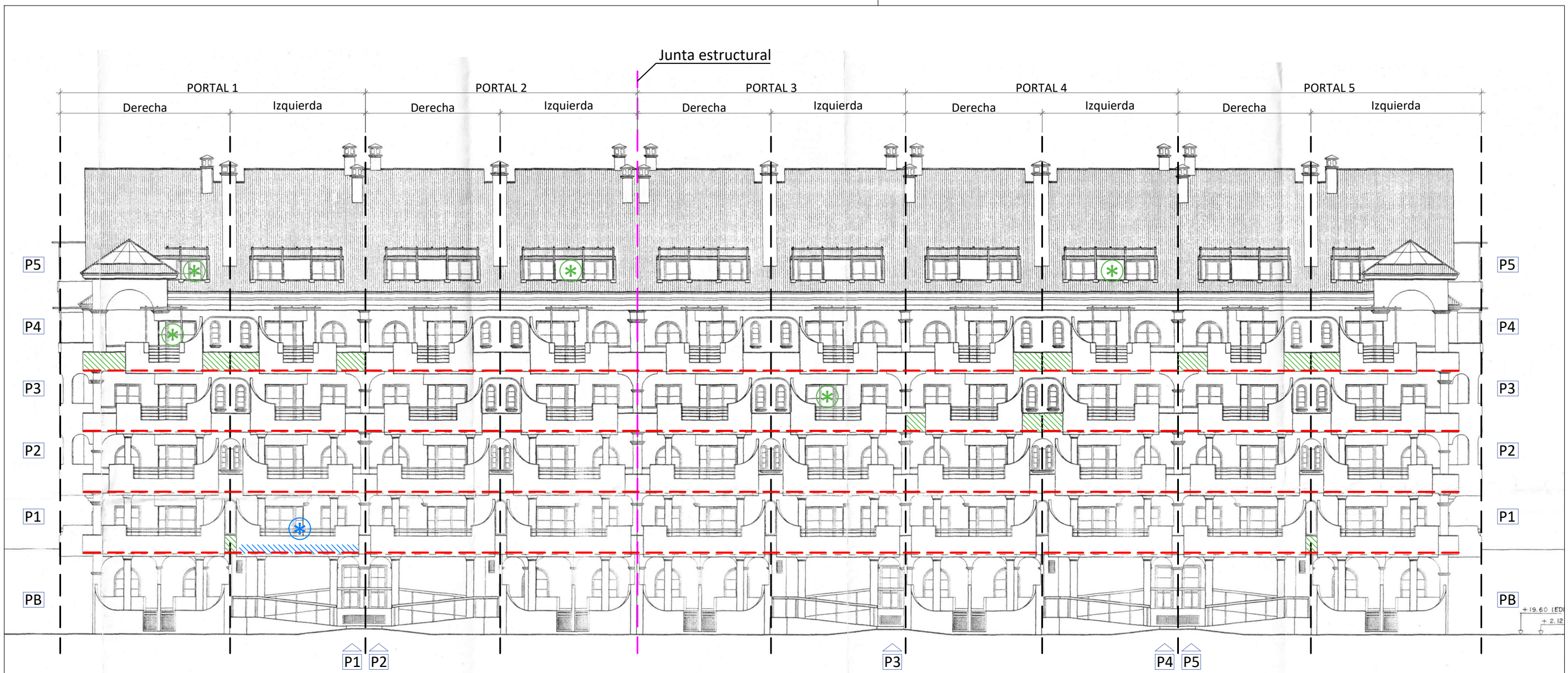
ALZADO PRINCIPAL NORESTE