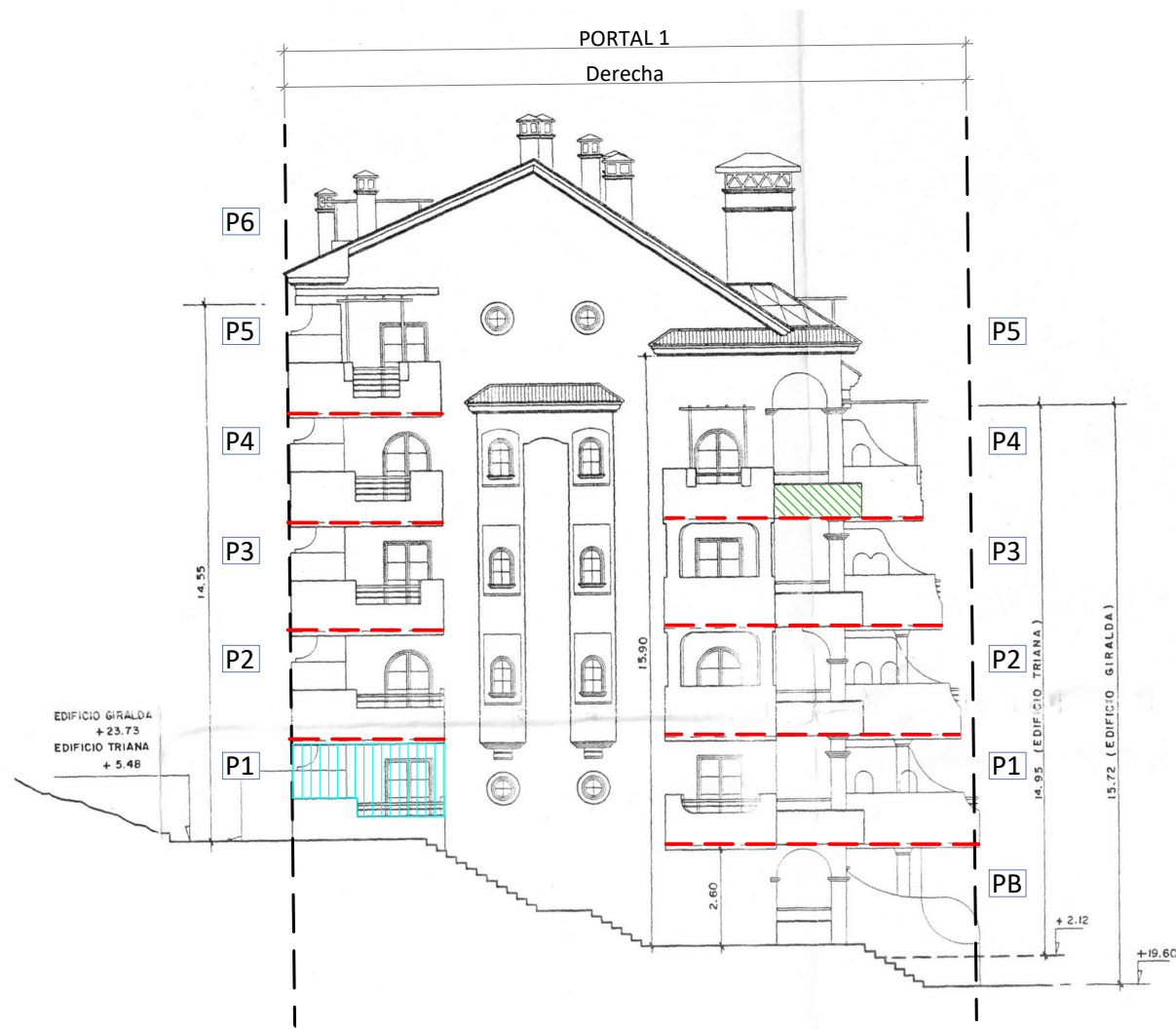
ALZADO LATERAL SURESTE